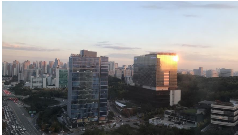
Aussicht vom Wohnheimzimmer