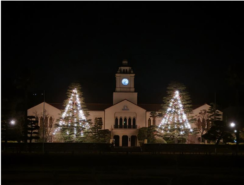
Die KGU an Weihnachten