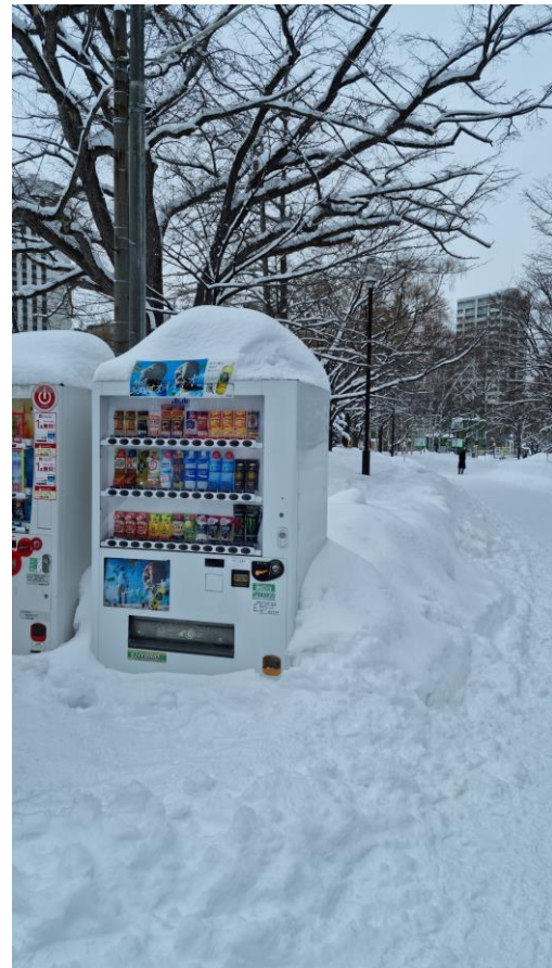
Getränkeautomat in Sapporo (Tipp: die heißen Getränke als Handwärmer kaufen)