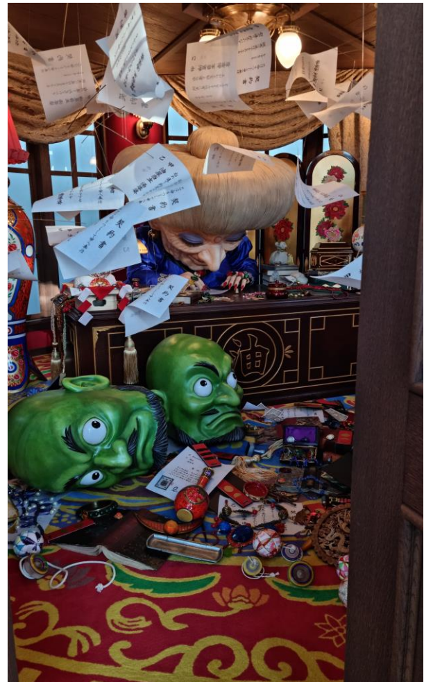
Im Studio Ghibli Park in Nagoya