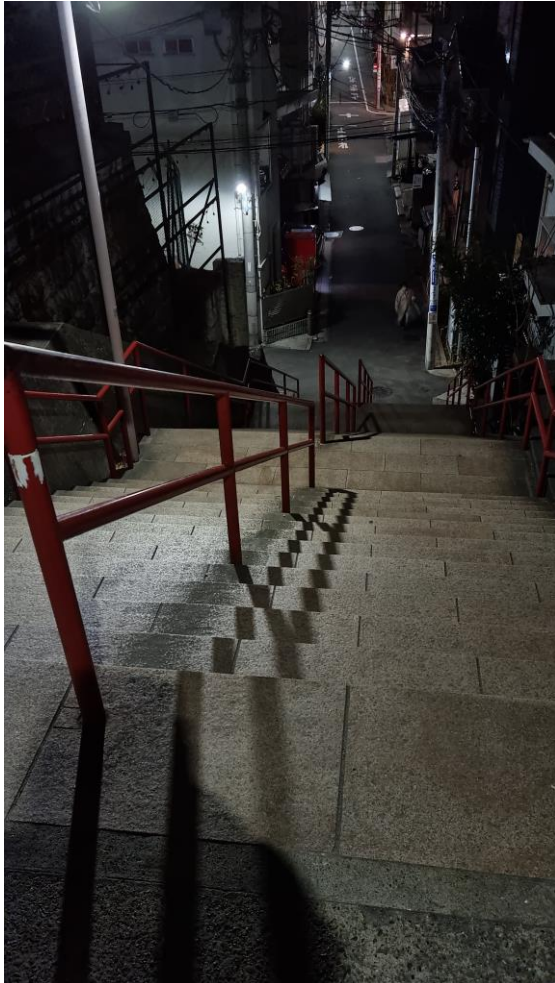
Treppen aus „Your Name“ in Tokyo