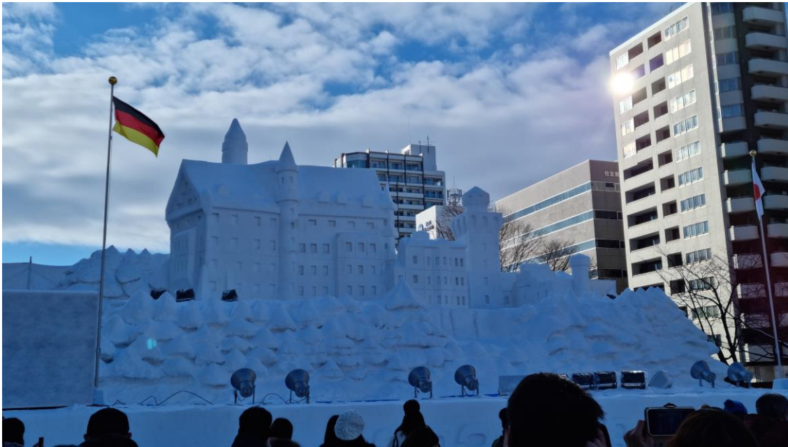
Schloss Neuschwanstein beim Schneefestival in Sapporo